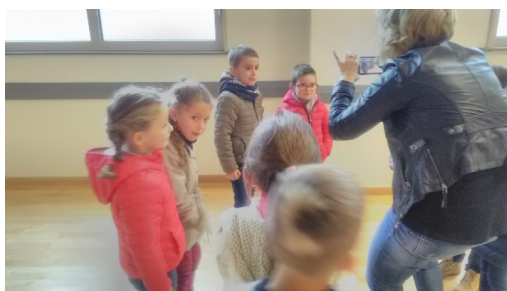
Dépouillement en présence des élus.