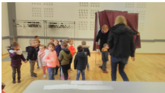
Les petits vont dans l'isoloir.

Souhaitons-leur un bon travail et toute la réussite nécessaire pour conduire leur projet !