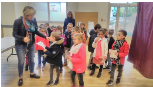
Les CP-CE1 et les CE1-CE2 se présentent munis de leur carte d'électeurs.