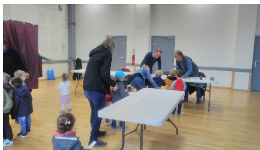
Les petits votent.